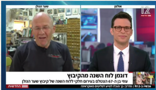
"מהדורה ראשונה" - ערוץ 12