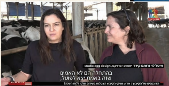
כתבה של גיא ורון, חדשות 12