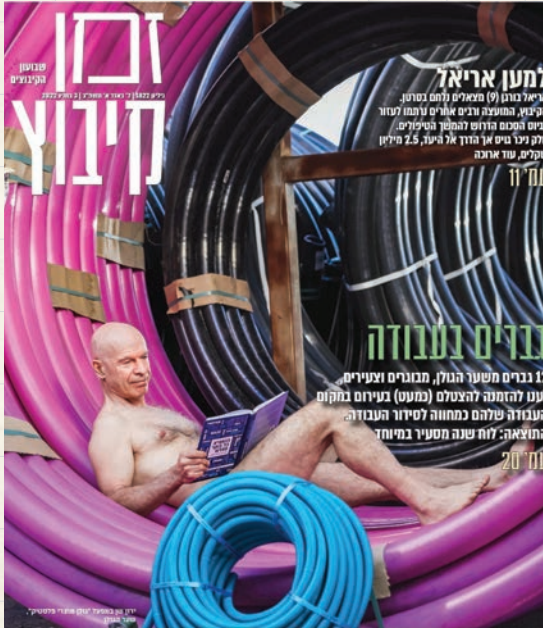
כתבת שער ב"זמן קיבוץ"