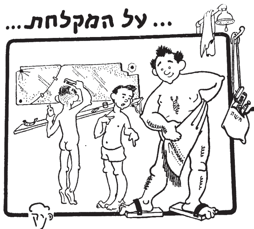
...הנני מרגיש כאן 20 שנה צעיר יותר..."

זה המקום להגיד תודה לנורית על ההגהה המדוקדקת שהיא עושה לעלון ומונעת שגיאות. וגם להזמין אתכם להעלות זכרונות ולספר סיפורי מקום נוספים, כאלה שלא נכנסו לאוסף הסיפורים בספר "משלנו". נשמח לפרסם אותם. ואולי נוציא יום אחד קובץ נוסף.