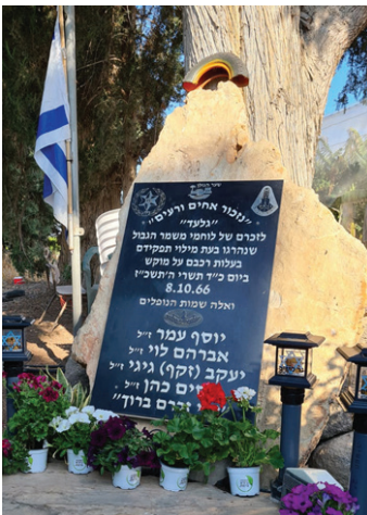
באתר הזיכרון לחללי משמר הגבול.

שבוע אחרי, באותו המקום ובאותה השעה התכנסנו לאחר הצפירה לטקס הפותח את יום הזיכרון לחללי מערכות ישראל ונפגעי פעולות האיבה. הטקס היה מכובד ומרגש והיה כניסה נכונה ליום הזיכרון. חדר הזיכרון נפתח אחרי הטקס ולמחרת. ביום הזיכרון התכנסנו לטקס המסורתי בבית הקברות ליד קבר האחים. השתתפו חברי שער הגולן מסדה, קרובי משפחה, חברים וחיילים.